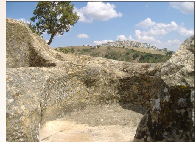
Palmenti Bizantini di Forenza