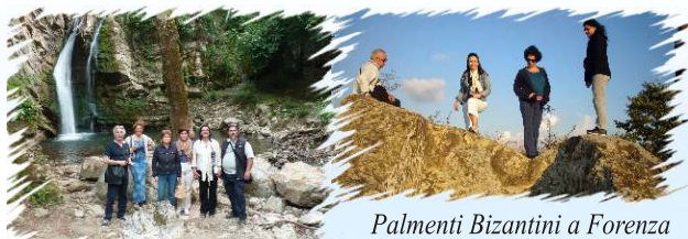
Cascate di San Fele