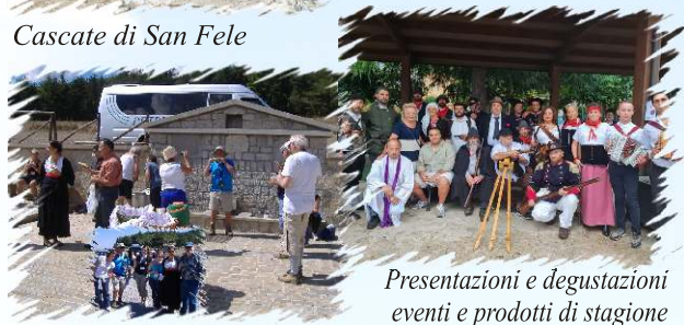
Presentazioni e degustazioni eventi e prodotti di stagione