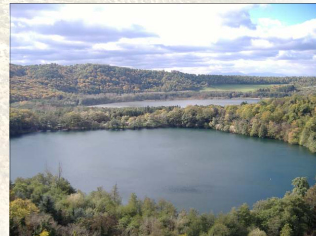
Laghi di Monticchio