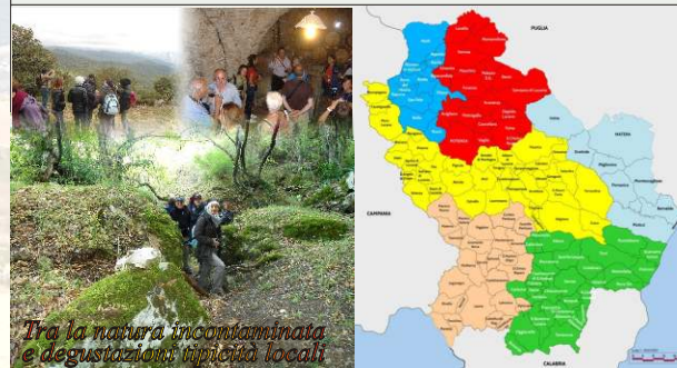
Tra la natura incontaminata e degustazioni tipiche locali