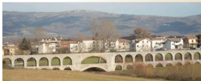
Acquedotto Cavour a Sarconi