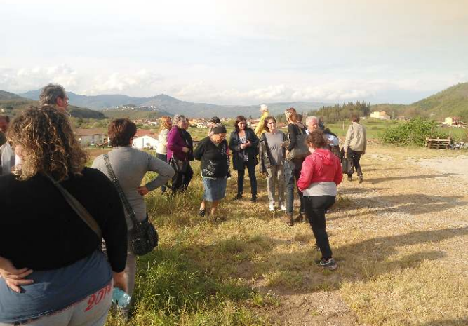
Visita c/o l'Azienda Agricola Belisario

Pomeriggio: visita agli scavi archeologici romani di Grumentum e partenza per le località di Provenienza.