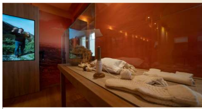
Museo della Pastorizia - Castelsaraceno