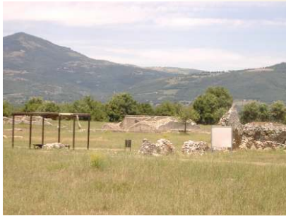
Sito Archeologico Grumentum