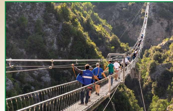
Il Ponte Tibetano più Lungo al Mondo