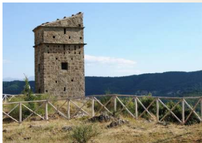
Torre Saracena - San Chirico Raparo

Il Parco Nazionale dell'Appennino Lucano-Val d'Agri-Lagonegrese è un'estesa fascia di area protetta interamente compresa nel territorio della Basilicata, il cui perimetro comprende alcune delle cime più alte dell'Appennino Lucano, richiudendo a ventaglio l'alta valle del fiume Agri. Posto a ridosso dei Parchi Nazionali del Pollino e del Cilento ne rappresenta un'area di raccordo e di continuità ambientale. E' il Parco Nazionale più giovane d'Italia, istituito con DPR dell'8 dicembre 2007, la cui notevole estensione longitudinale ne fa un'area ricca di una serie di interessanti biotopi, che vanno dalle fitte faggete delle alture, al caratteristico abete bianco, fino alle distese boschive che si alternano a pascoli e prati. Le tante aree coltivate sono il segno della forte presenza della mano dell'uomo in questo Parco che, come dimostrano l'area archeologica di Grumentum e le numerose mete religiose, fin dall'antichità si presenta come uno splendido crocevia di tradizioni, arte, cultura e fede..