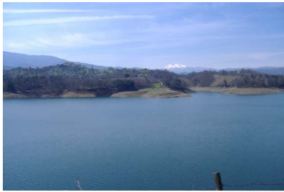
Lago artificiale del Pertusillo