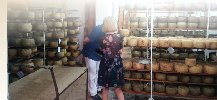
Visita c/o i Fondaci di Stagionatura del Canestrato di Moliterno

- C.da Pantanelle, 21, 85047 Moliterno Pz